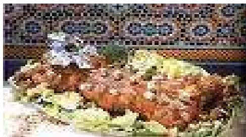
LA RICETTA DEL TAVE KOSI ovvero dell'agnello al forno con yogurt

Marocchina. Re dei piatti agrodolci è il curry, preparato con una miscela di ben 35 spezie. Ottimi sono i vini di Meknes. Il the alla menta viene servito zuccherato e con una foglia di menta fresca in piccoli bicchieri di vetro ed è una bevanda molto dissetante e rinfrescante.