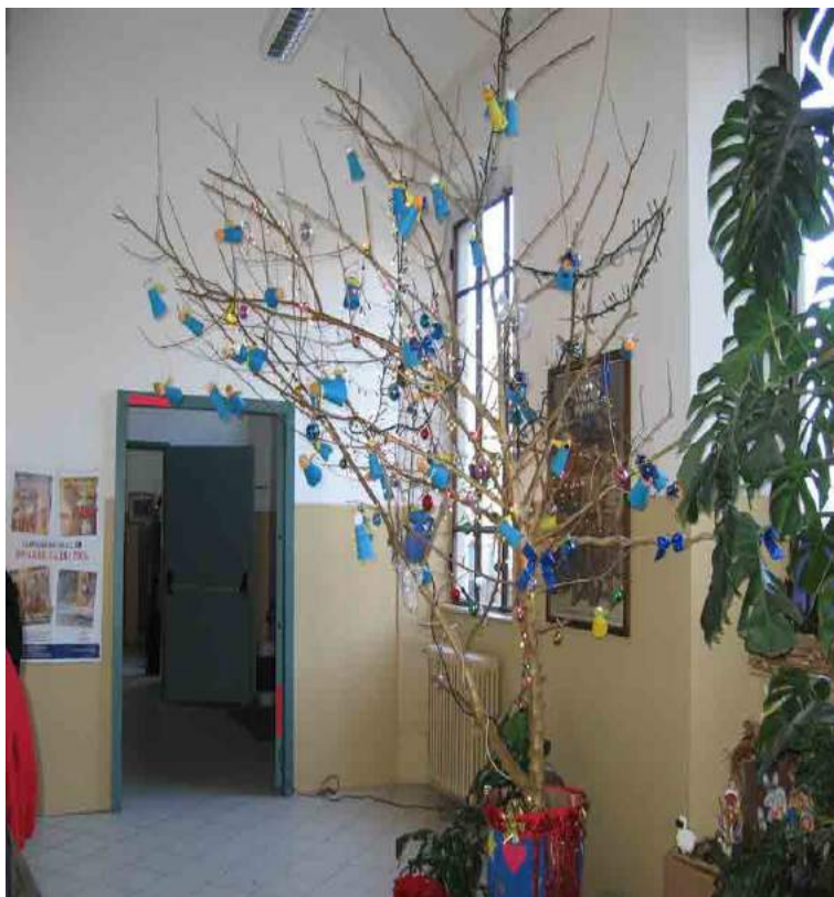
Il nostro albero di Natale ornato con angeli realizzati da noi!!!